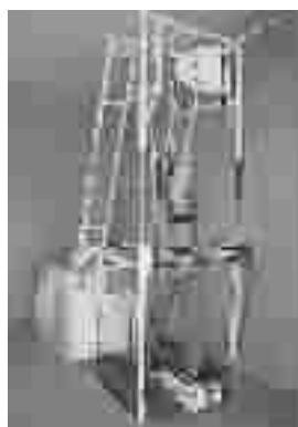
图6 MGT 型步行康复训练机器人

图8是哈尔滨工程大学机电工程学院研制的步行康复训练机器人(lower limbs rehabilitative robot, LLRR) [13-14] ,其设计与 MGT 型步行康复训练机器人相似。它由走步状态控制系统、脚部姿态控制系统、框架、导轨等组成。走步状态控制系统主要由主动曲柄、连杆、脚踏板和滑轮组成。主动曲柄由直流伺服电机驱动,患者脚部随活动踏板一起做被动运动,形成一个椭圆轨迹,产生与正常人行走轨迹相近的运动轨迹,同时由于脚跟随踏板运动,患者的小腿和大腿处于相应