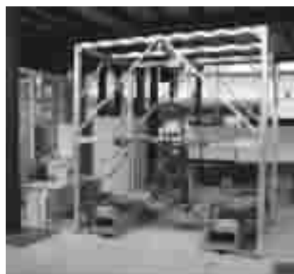
图7 Haptic Walker 步行康复训练机器人