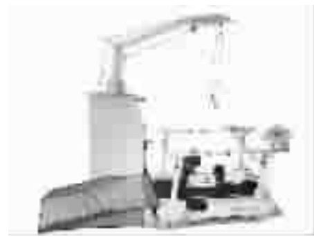
图 11 LOKOHELP 辅助步行训练装置

图 11 是美国 WOODWAY 公司于 2006 年推出的由 WOODWAY 医用电动跑台直接驱动的 LOKOHELP 辅助步行训练装置。LOKOHELP 安装有一个摩擦轮,与跑台滑带接触从而获得动力,驱动链条带动人腿摆动。链条安装在一个轨道上,因此人腿的摆动轨迹与轨道一致。两腿相位相差 180°。