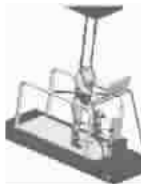
图5 ARMS 步行康复训练机器人