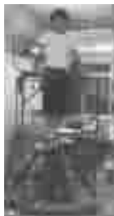
图 9 GaitMaster-1 全方位型

图 9—10 是日本 Tsukuba 大学虚拟现实研究室推出的 GaitMaster 的步行康复训练机器人 [5] 。GaitMaster-1 是全方位型,由两个踏板组成,每个踏板由 3 个液压缸支撑组成 3 自由度并联机构,能够拟合任意方向的轨迹,模拟任意方向的步态。GaitMaster-2 是直线型,也由两个踏板组成,每个踏板安装在升降台上,升降台安装在直线导轨上,由直流电机驱动,具有 2 自由度,能够模拟直线方向的步行轨迹。GaitMaster 同样能够为患者提供平地、上下坡、上下楼梯等多种步行训练模式。