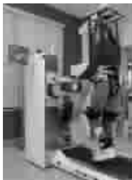
图4 AutoAmbulator 步行康复训练机器人