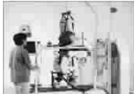
图 1 LOKOMAT 步行康复训练机器人

LOKOMAT 采用电机驱动,每条腿安装有两台电机。电机安装在机械腿的腰部机架和腿大腿杆上,分别驱动一套丝杠螺母机构,通过丝杠转动推动机械腿大腿和小腿摆动,完成步行动作。同时,安装在机械腿关节处的传感器将机械腿关节的角度和驱动力等信息反馈给控制计算机。LOKOMAT 的优点是:①患者的训练状态能够被监测,评价和引导;②能够根据患者个体不同提供相应的步态模式和训练方案;③能够通过虚拟现实技术为患者提供反馈以提高患者参与训练的主动性。