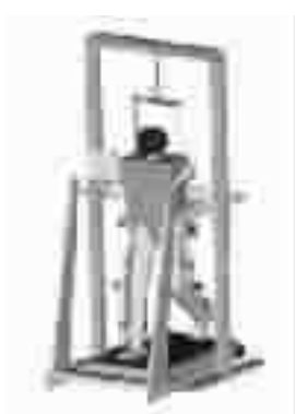
图3 清华大学 GRTS 步行康复训练机器人

此外美国加州大学洛杉矶分校也提出了 ARMS 步行康复训练机器人的设计方案(图5)。ARMS 由四个机械手组成,分别与患者下肢大、小腿相连。气缸驱动机械臂在计算机的控制下协调伸长或缩短,牵引患者下肢摆动完成步行动作。