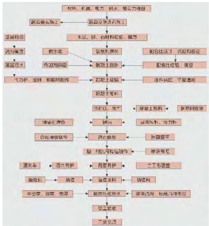
图1 施工工艺流程图