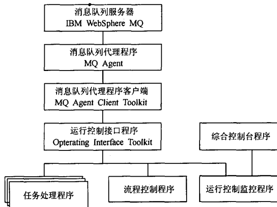
图 2 运行控制软件包的组成

4.2.1 运行控制 运行控制负责维护消息队列服务器的运行，提供访问消息队列的接口，实现分系统中各类处理任务的提交、获取和调度，以及提供其它与运行控制有关的辅助功能。包括以下软件：消息队列代理软件、消息队列代理客户端软件、运行控制接口软件、综合控制台软件、流程控制软件、运行控制监控控制台软件和高性能计算任务监控软件，其组成如图 2 所示。