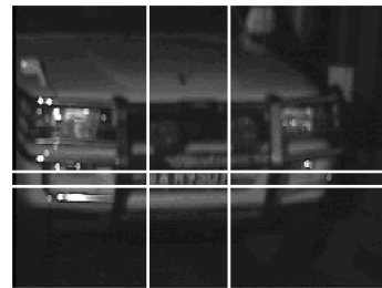
图5 车牌定位过程: 原始图片定位结果

有时候选区域往往不只一个, 这就需要利用字符本身的特征剔除伪车牌, 即字符一般水平排列, 扫描行经过牌照区域时会有规律性的起伏 [5] . 对于我国目前通用的牌照, 字符个数一般为 7 个, 灰度跳变次数应在一定的范围内, 经本文实验测得次数应在 5 \sim 30 之间. 为使每次扫描行完全通过号码体, 只选取定位后原始图像候选区域高度的 1/3 到 2/3 的部分, 进行二值化, 然后连续穿线, 若每次穿线均符合上述规律, 可认定已经找到真正的车牌区域. 图 5 为原始图片定位结果, 图 6 为牌照实际尺寸.