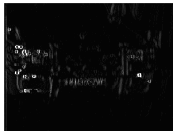
图 2 车牌定位过程:沿水平方向 Sobel 算子检测结果