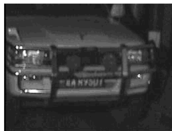
图 1 车牌定位过程:模糊和部分遮挡的原始图片

对于一般的汽车车头图像来说,水平纹理要远大于垂直纹理,而对于车牌,本身的垂直纹理则相反,因此垂直边缘在抑制噪声方面优于水平边缘,可将车牌本身的垂直纹理特征作为判定的主要依据。同时,由于采集的摄像头模糊,以及一些车牌边框磨损严重,只能利用车牌内部字符纹理进行定位。故采用 Sobel 水平方向边缘检测算子 [8] 检测原始图像,如图 1 所示,得到一幅仅保留垂直纹理边缘的图像,如图 2 所示。进行区域分割时, Otsu [9] 是一种常用的方法,因其有较高的鲁棒性和快速性,将图 2 用此方法进行分割,得到图 3。