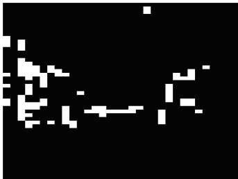
图4 车牌定位过程: 分块搜索结果

其中 Den 为边缘密度, m 为子图像中白像素点个数, w 为子图像宽度, h 为子图像高度. 对于汽车牌照的尺寸, 字符个数, 大小, 笔划宽度, 都是国家统一制定的, 因此其边缘密度值应在一定范围之间, 而位于牌照中的子图像也会具有同样的性质. 本文经过大量实验得出: 一般车牌的边缘密度值大于 0.2, 由此, 可将大于此阈值的子图像全部标记成白色, 作为目标区域, 小于此阈值的子图像标记成黑色, 作为背景区域. 经过此操作, 图像变成由一些单元块构成的几个连通的区域, 如图 4 所示. 利用四连通的种子填充技术检测连通区域边界, 拉伸为矩形.