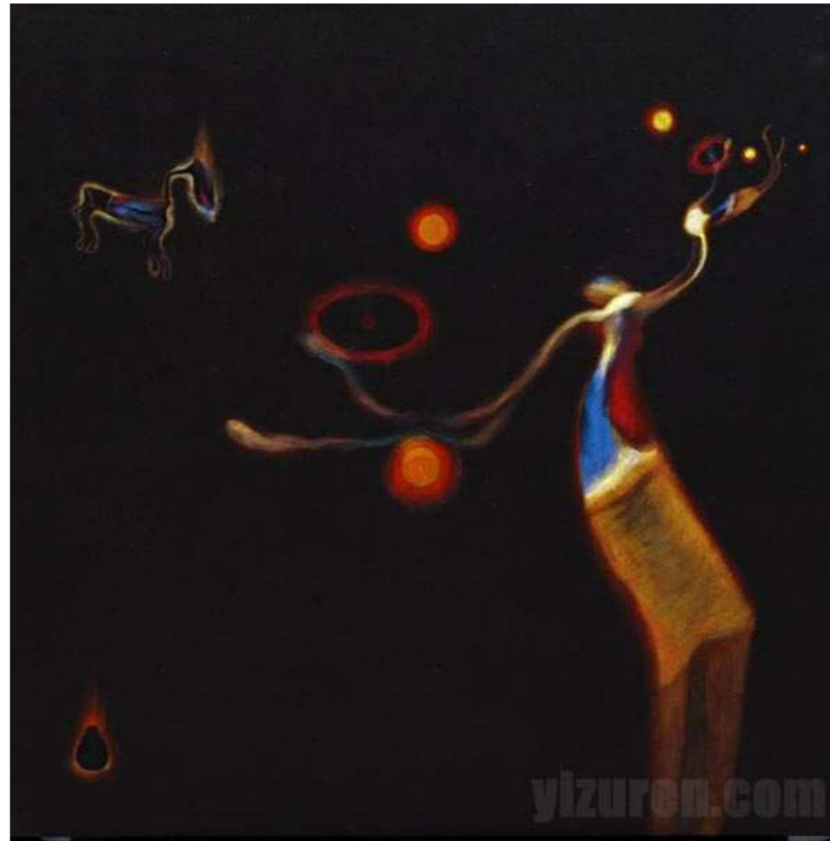
阳光照进属马的女儿