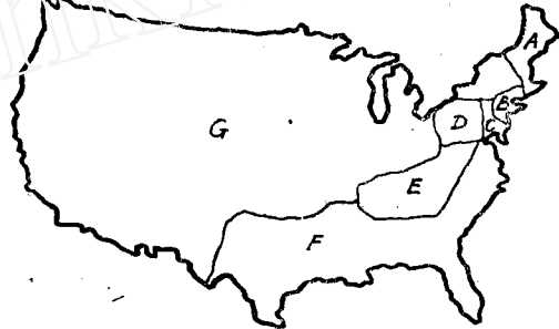
图二：杰·纳斯特所主张的美国主要方言区。

A. 新英格兰东部；B. 纽约；C. 大西洋中部；D. 宾州中部；E. 南部；F. 南方山区；G. 密特兰(内陆)中部；H. 西北部；I. 西南部。