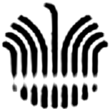
图8 武汉热线的标志