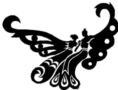
图3 梁祝文化公园标志

一则是我国旅游业的标志设计。凡是到中国来旅游观光的海外华人及各国游客,首先接触的不是雄伟的长城,也不是令人惊叹的秦兵马俑,而是象征东方文明大国旅游业的圆形标志“马踏飞燕”(见图4)。马踏飞燕是东汉时期雕塑艺术和铸铜工艺融为一体的杰出作品,在中国雕塑史上代表了东汉时期的最高艺术成就。铜马昂首,四蹄翻腾,马尾高扬,口张作嘶鸣状,以少见的“对侧快步”的步伐奔驰向前。其三足腾空,后右蹄踏在一只正在振翼奋飞的燕背上,燕顾首惊视,与之相呼应,奔马头微左顾,生动体现了奔马速度之快。而这一切尽在瞬间。由于马蹄之轻快,马鬃马尾之飘扬,恰似天马行空,以至飞燕不觉其重而惊其快,更增加了铜马凌空飞驰的气势。该器堪称我国古代雕塑艺术史上神奇而稀有的瑰宝,而现其形为中国旅游标志,寓意一日千里,马到成功。