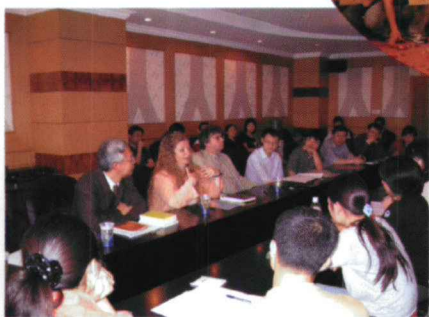
本科生层面的双语双文化节学术交流