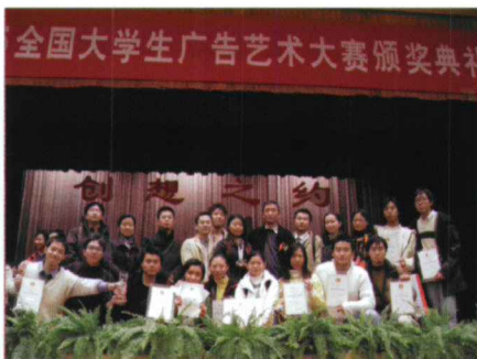
全国广告大赛在人民大会堂颁奖