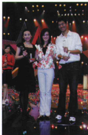
上海市“公关新星”比赛亚军