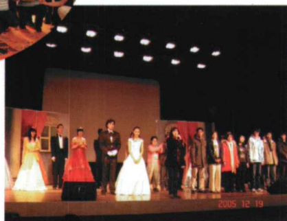
“明日剧社”十年汇演