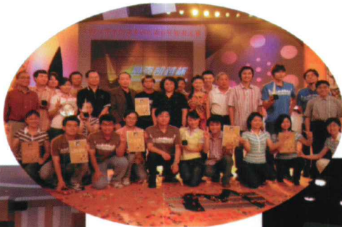
上海大学生纪念 中国电影百年知 识大赛冠军