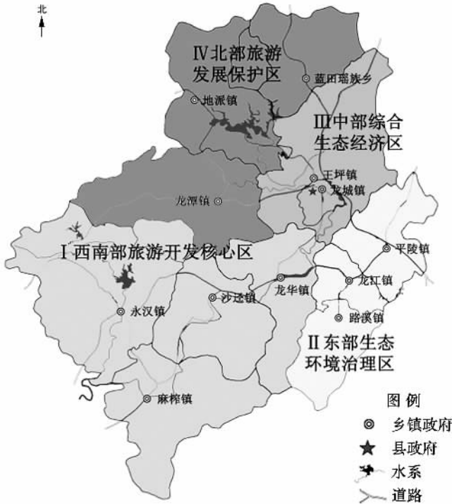
图 3 龙门县旅游保护性开发区划图