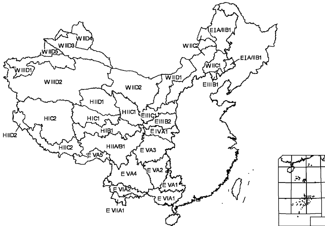
图 2 西部土地利用程度分区示意图

综合得分值大致介于 -11.5 \sim 5.0 之间。空间展示的综合得分值格局表明：得分值 V > 0.1 的评价单元主要分布于东部季风影响区，是得分高值区； V 值介于 -3.3 \sim 0.1 的评价单元主要分布于新疆北部、青藏高原东南端和内蒙古中东部； V < -6.6 的评价单元集中分布于新疆的南部、青藏高原的北部和内蒙古的西北端，是得分低值区；其它地区的 V 值介于 -3.3 \sim -6.6 。 V 值反映含有结构性映射的土地利用程度的综合评价状况，其基本格局反映了综合生态地理条件的总体分异特点，是具体分区定界的主要参考。 V 值越高，说明综合生态地理条件越好，土地利用率和土地利用集约性程度越高，主要表现为土地利用率高、农业用地指数、垦殖率、森林覆盖率和林地利用率高。 V 值越低，则与上述情况相反，主要表现为牧草地比重较高，而其它用地指数较低则反映未利用土地比重较大。