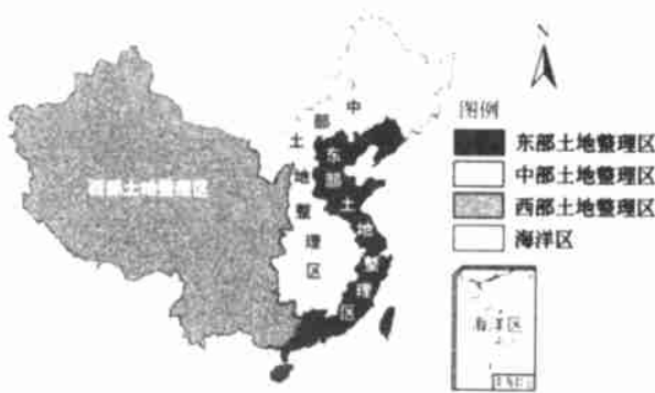
图 1 中国土地整理一级区划示意图

根据我国土地整理区划方案 [1] , 土地整理区域发展方向与社会经济条件紧密联系。以我国东部发达区, 中部较发达区和西部大开发区所涉及区域的地理界线作为全国土地整理的一级控制区。同时将海洋水域部分单独作为一个特殊区域。