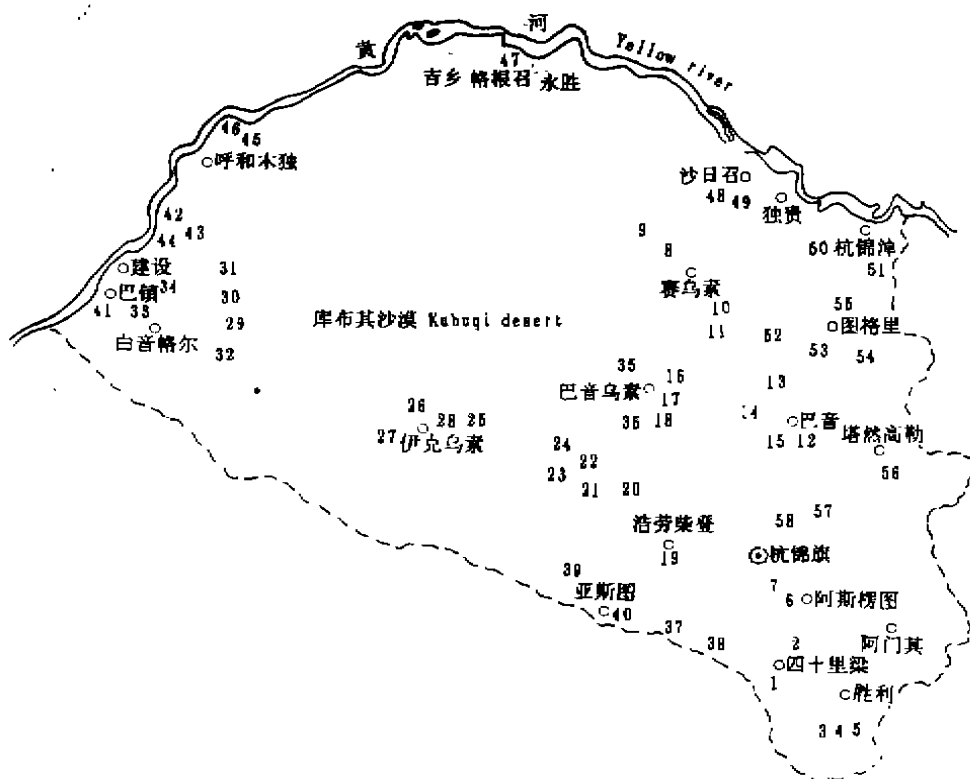
图 1 库布其沙漠及毗邻地区鼠类调查样方分布图 (图中数字为样方序号) Fig. 1 The distribution map of plots investigated in Kubuqi desert and adjacent region (Numbers on the figure were plots investigated)

调查共设样方 58 个,各样方的选择是依据地带性植被类型中具有代表性的生境中选取。各样方的分布如图 1。本次调查共捕鼠类 11 种,1 108 只,其中小毛足鼠 Phodopus roborovskii 337 只,占 30.42%;三趾跳鼠 Dipus sagitta 322 只,占 29.06%;五趾跳鼠 Allactaga sibirica 182 只,占 16.43%;子午沙鼠 Meriones meridianus 117 只,占 10.56%;草原黄鼠 Citellus dauricus 51 只,占 4.60%;黑线仓鼠 Cricetulus barabensis 45 只,占 4.06%;长爪沙鼠 Meriones unguiculatus 36 只,占 3.25%;短尾仓鼠 Cricetulus eversmanni 9 只,占 0.81%;三趾心颅跳鼠 Salpingotus kozlovi 4 只,占 0.36%;灰仓鼠 Cricetulus migratorius 3 只,占 0.27%;蒙古羽尾跳鼠 Stilodopus andrewsi 2 只,占 0.18%。