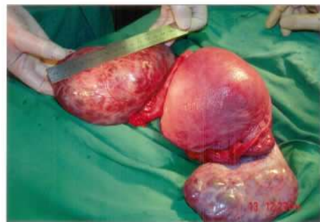
图1 多囊卵巢的大体标本