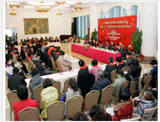
推进报社品牌活动提升品牌价值

早在5年前，《纽约时报》就已经开始尝试从网络上赚钱。2005年9月，《纽约时报》启动了一项名为Times的订阅服务，在网上对许多以往免费的专栏进行收费。2007年9月17日，《纽约时报》宣布停止对部分网站内容的收费，证实了许多媒体业内人士的观点——从读者那里收取的费用，无法超越从免费网站上得到的额外广告收入。此后，在对读者几乎开放整个网站内容的同时，《纽约时报》向读者免费提供了从1987年至今的所有《纽约时报》内容。