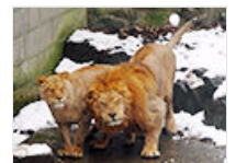
游客雪球砸狮子取乐