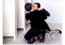
教师淫辱11岁女生3年