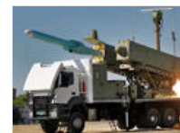
伊朗导弹有中国血缘