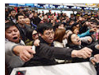
昆明机场万人滞留