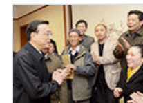
李克强慰问村医生座谈