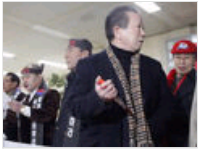
韩男子切腹反日特使