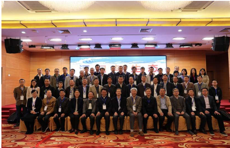
参会领导、专家、学者合影

本届河口专委会年会的参会人数、学术交流专家人数与报告质量都是历届之最，可为今后学术年会的举办提供借鉴。会后，海河水利委员会组织部分专家、学者赴天津实地考察了屈家店水利枢纽、海河防潮闸及三岔河口等工程的设计、运行与防潮排沙效果。