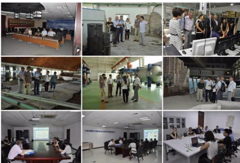
参观实验室及现场交流

来访期间，代表团还参观了我院的VR平台实验室、中水科技自动化监控实验室、中水科海利公司结构材料实验室以及我院大兴试验基地泥沙试验厅、水力学试验厅及水力机械实验室等，并专题参观了中水科技的三峡远程状态监测与故障诊断中心，与专家就水库大坝及机电设备等的安全监测进行了深入讨论。