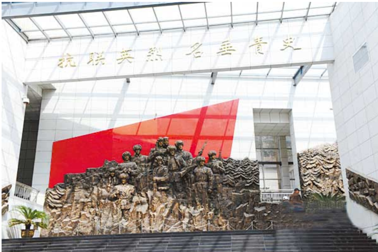
东北抗联史实陈列馆