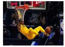
NBA全明星赛火热上演