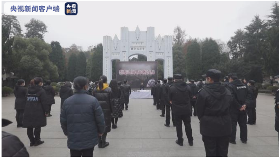
(总台央视记者 李艳君 怀化台 芷江台)

车侵平暴行和奴颜，这批物品公开后，将放入中国人民抗日战争胜利受降纪念馆供游客免费参观，警示人们铭记历史、勿忘国难、珍惜和平。