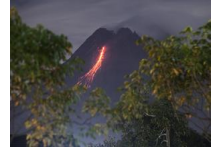
印尼默拉皮火山喷发