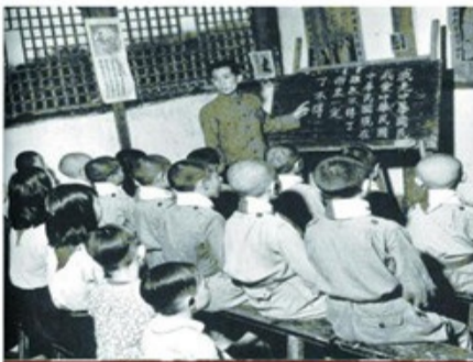
单楼小学教学课堂