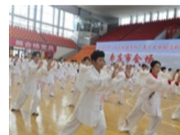
全国老年人太极拳健身推广