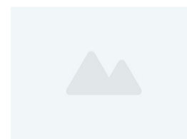
2016年1月1日起枣庄实行