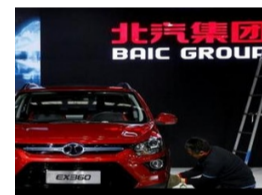
2019中国纯电汽车销量