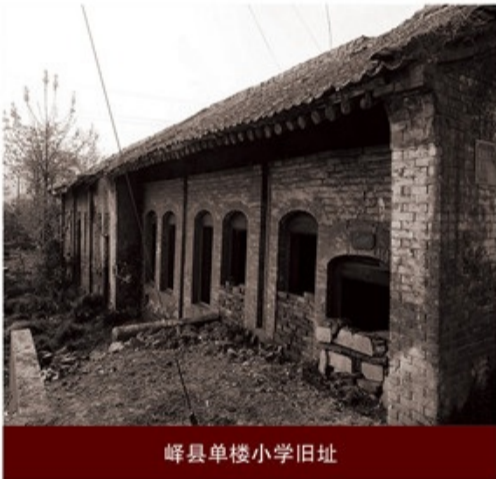
峰县单楼小学旧址