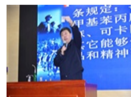
枣庄市实验学校开展禁毒宣