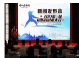
2017年第三届山东武术大