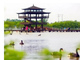
春暖花开 为你而来 | 双龙