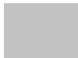
2017首届创新型企业家法