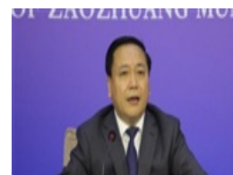
【新闻前沿】今后三年枣庄