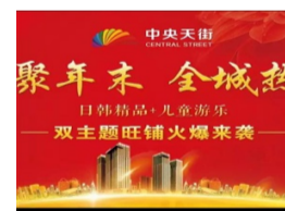
中央天街“荟聚年末，聚惠