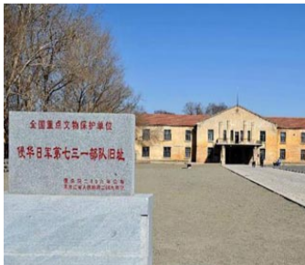
侵华日军731部队遗址将建战争遗址公园