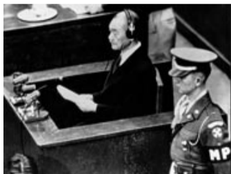
东京审判里的侵华日军主犯