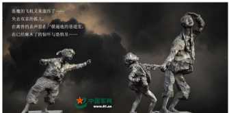
侵华日军南京大屠杀遇难同胞纪念馆大型群雕