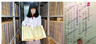
铁证如山 吉林省新发掘89件日本侵华档案