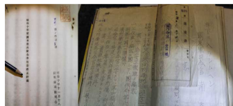
吉林档案馆公开靖国神社供奉的甲级战犯一批侵华罪证