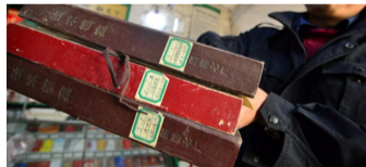
青岛市民废品店中抢救出百份侵华物证