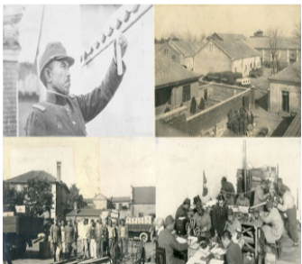
侵华日军1855部队影像铁证首曝光：罪行堪比731部队