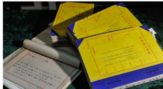
吉林新发掘侵华日军档案显示：强征慰安妇是日本的政府行为