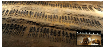
吉林辽源矿工墓揭示日本侵华罪行