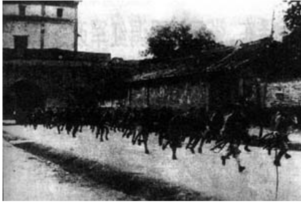
宛平城守军闻日军侵犯，紧急出城赴战

由于全国人民要求抗战的压力，以及日军的侵略严重损害了英、美的在华利益，直接威胁到蒋介石等四大家族的统治，国民党政府被迫于8月中旬发表《自卫宣言》，起来抗战，并接受了中国共产党提出的建立抗日民族统一战线的主张。同时，南京国民党政府军事委员会宣布将红军改编为国民革命军第八路军，任命朱德为总指挥，彭德怀为副总指挥。不久以后，南方各地的红军游击队也改编为新编第四军，叶挺任军长。抗日战争民族统一战线的形成为抗日战争的胜利打下了基础。从此，一场以中国共产党人为中坚力量的伟大民族解放战争轰轰烈烈地展开了。