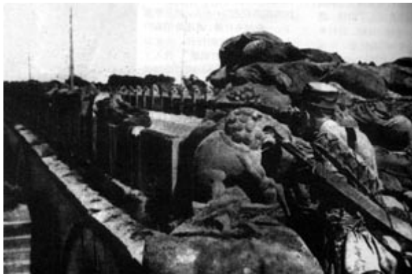
29军战士守卫在卢沟桥