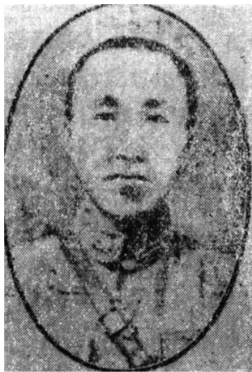
第四十八路义勇军司令——郑桂林