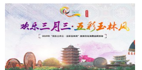
欢乐三月三·五彩玉林风