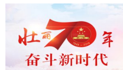
壮丽70年·奋斗新时代