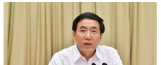
玉林市双拥工作领导小组成员会议暨庆祝建军92周年军政座谈会召开

玉林市委全面依法治市委员会召开第一次会议 【壮丽70年】“五彩”玉东活力十足 发展日… 【环球行·看世界之十一】站在智利的海岬上 广西医科大学玉林校区二期建设稳步推进