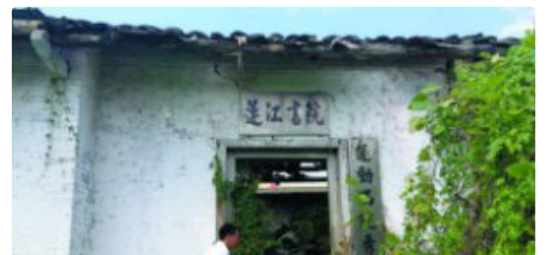
博白莲江书院盼获“新生”

玉林市“最美退役军人” 玉林市“十佳自主创业退役军人” 兴业县大平山：园区企业成为就业扶贫主战场 福绵区上坡村：激活土地活力助乡村振兴