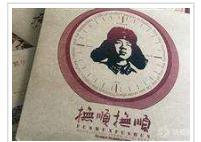
卢然: 你知道歌曲《抚