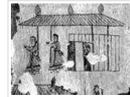
高句丽, 消失的古代文