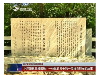
铭记来时路 弘扬抗联魂 小汪清抗日根