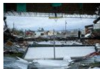
4级飓风“迈克尔”登陆美

受贿奇葩理由:不收便宜他们 生命教育亟需补课 如何拍出高逼格朋友圈照片 各地惊险的机场跑道 护士抱狗上班 医院成啥了 教你如何请到好保姆 暗拍“毛血旺”制作全程 反家暴法不宜过度“延展”