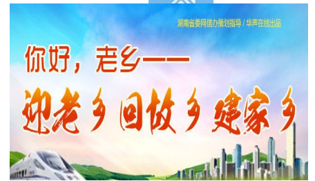
【专题】你好，老乡——迎老乡 回故乡