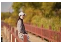
俱乐部活动偶遇的长腿美