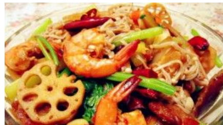
长沙河西大学城10大绝味美食