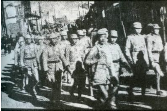
中国军队胜利回长沙。

2015年8月21日，长沙市岳麓山。1939年至1944年，日军数次进攻长沙期间，中国军队利用岳麓山的高地势布置重炮旅，给入侵长沙的日军进行了毁灭性打击，对保卫长沙城起到重大作用。