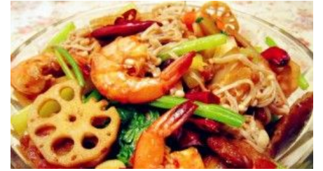
长沙河西大学城10大绝味美食