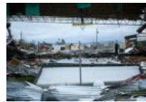
4级飓风“迈克尔”登陆美

受贿奇葩理由：不收便宜他们 生命教育亟需补课 如何拍出高逼格朋友圈照片 各地惊险的机场跑道 护士抱狗上班 医院成啥了 教你如何请到好保姆 暗拍“毛血旺”制作全程 反家暴法不宜过度“延展”