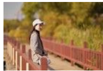
俱乐部活动偶遇的长腿美