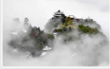
游人踏雪游崆峒 尽享秋日冬景