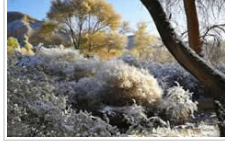
甘肃南南秋雪后银装素裹