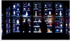
游客利用现代科技体验故宫养心