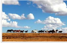
黄河源头秋景如画 野生动物频