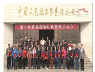
抗战馆举办第八届抗战将领后代趣味运