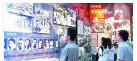
忆昔抚今 重温抗战精神

抗战胜利70周年主题展览开幕 抗战馆专场三天已接待超万人 文物背后的抗战硝烟 纪念抗战胜利主题展将展出照片1170幅文 我军将开展系列活动纪念抗战胜利70周年