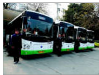
88岁公交见证武汉变迁