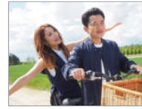
李亚男王祖蓝甜蜜合照