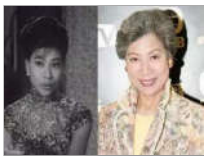
她们年轻时居然这么美!