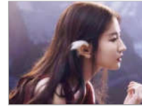
刘亦菲颜值美出新高度