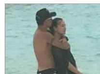
娱乐大亨搂小三海边亲热