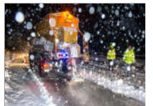
这场暴雪，幸亏有他们！