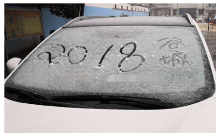
湖北网友快来看，你的家乡下雪了吗？