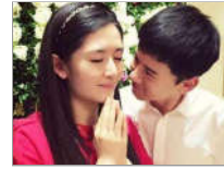
娱乐圈姐弟恋大揭秘