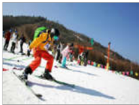
湖北各地喜迎新年