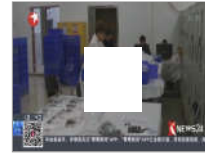
宋代沉船“南海1号”发现