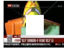
“潜龙三号”完成南海航启