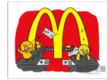
麦当劳将停用抗生素鸡