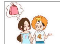
七夕买包，男友如何应对？