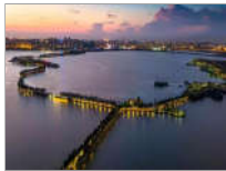
50多万人游东湖绿道