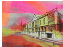
看19世纪后期的老汉口