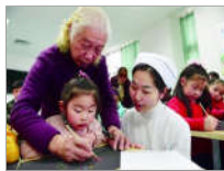
退休美术老师重返医院