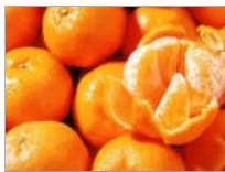
橘子皮48种神奇妙用