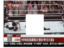
世界摔跤顶级赛事首次登国