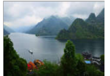
湖北文明县城，她竟排第一