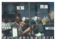
陈伟霆带巴西嫩模见家长