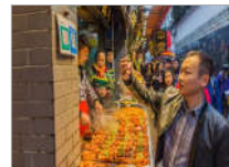
武汉，二维码无处不在