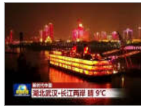
央视聚焦武汉美景