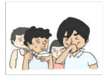
陷入传销如何自救？