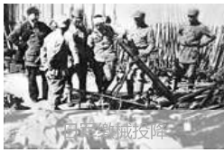
日寇低头缴械，有手枪、步枪、轻机枪、子弹、大炮等。