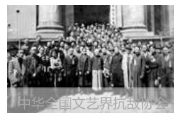
武昌千家街8号大院