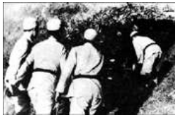
枣宜会战张自忠将军殉国