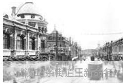
1945年日本投降，曾属英俄法德日五国租界连成一体。