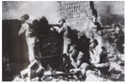
陆战之保卫大武汉

1938年6月至10月，中国军队在武汉地区同日本侵略军展开大规模会战。战场在武汉外围沿长江南北两岸摆开，遍及鄂皖豫赣4省，大小战斗数百次，毙伤敌4万人，大大消耗了日军有生力量。抗日战争从此进入战略相持阶段。