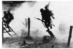
鄂西会战中日军无功而返