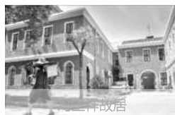
武汉江岸区长春街57号