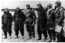
空战击落日军飞机