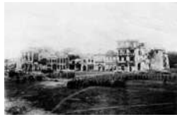
日军在宜昌发动毒气战