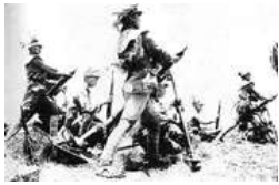
随枣会战粉碎敌人西进

1938年10月25日，武汉沦陷后，国民政府西迁重庆，大西南成为中国抗战的战略大后方。湖北作为由华中进入西南、西北的重要通道之一，成为抗击日军、拱卫战时首都重庆和为战略大后方提供有力屏障的最前线。