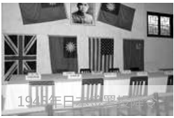
1945年9月18日下午3点，日军投降代表，呈上投降证书。