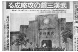
日军攻陷武汉三镇