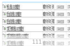
武汉市汉口民意一路