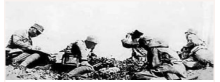
八路军第一一五师的著名战斗