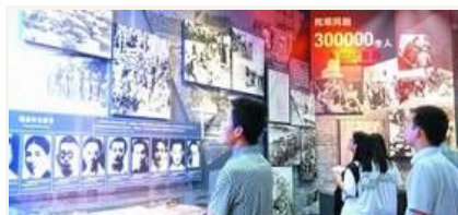
忆昔抚今 重温抗战精神