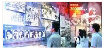
忆昔抚今 重温抗战精神

抗战胜利70周年主题展览开幕 抗战馆专场三天已接待超万人 文物背后的抗战硝烟 纪念抗战胜利主题展将展出照片1170幅文 我军将开展系列活动纪念抗战胜利70周年