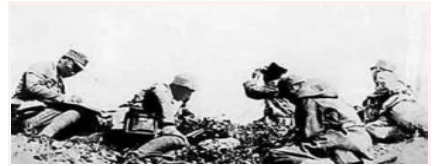
八路军第一一五师的著名战斗