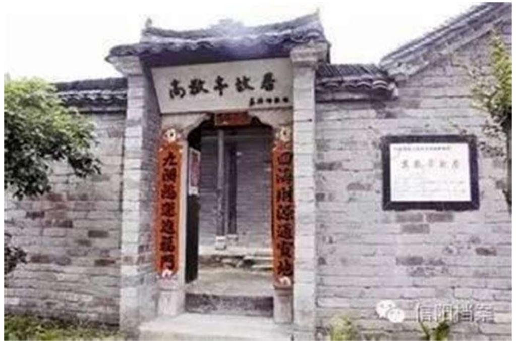
(位于新县新集镇内的高敬亭故居)

1939年1月17日，中共豫鄂边省委委员、军事委员会副主任李先念，根据省委决定，率新四军独立游击大队从竹沟南下四望山，开展豫鄂边区游击战争，创建根据地。