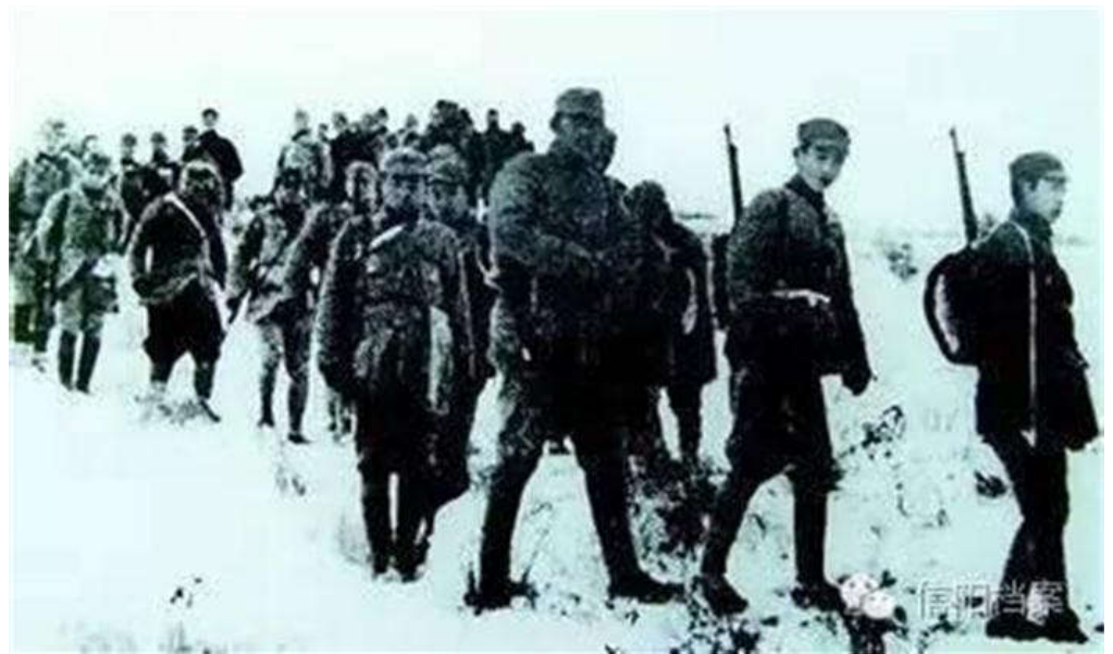
(新四军豫鄂独立游击大队挺进四望山)

1939年1月17日，中共豫鄂边省委委员、军事委员会副主任李先念，根据省委决定，率新四军独立游击大队从竹沟南下四望山，开展豫鄂边区游击战争，创建根据地。