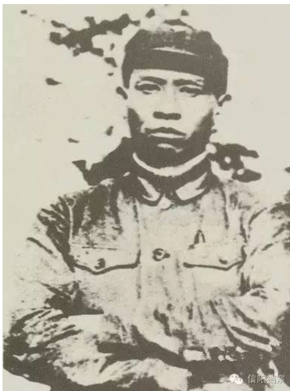
(中原局书记刘少奇)

1939年11月7日，中共豫鄂边地委机关报《先锋报》在四望山创办，中原局书记刘少奇题写了报头。