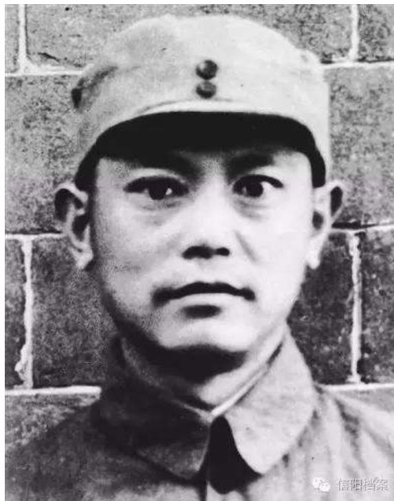
( 新四军豫鄂独立游击支队司令员李先念)