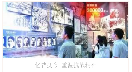
忆昔抚今 重温抗战精神

抗战胜利70周年主题展览开幕 抗战馆专场三天已接待超万人 文物背后的抗战硝烟 纪念抗战胜利主题展将展出照片1170幅文 我军将开展系列活动纪念抗战胜利70周年