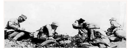
八路军第一一五师的著名战斗