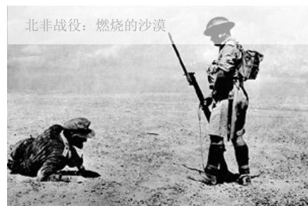
北非战役：燃烧的沙漠