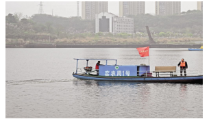
宜昌：退捕渔民巡护长