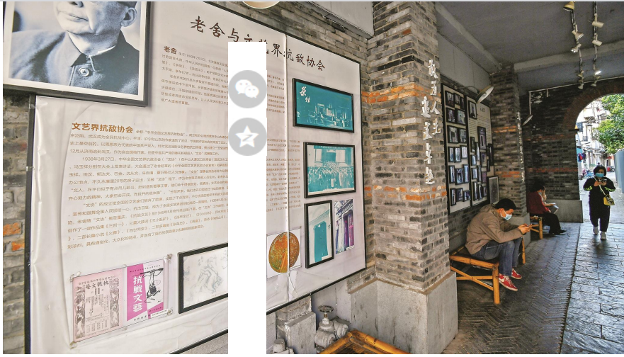
墙壁上老舍先生与“文协”的故事