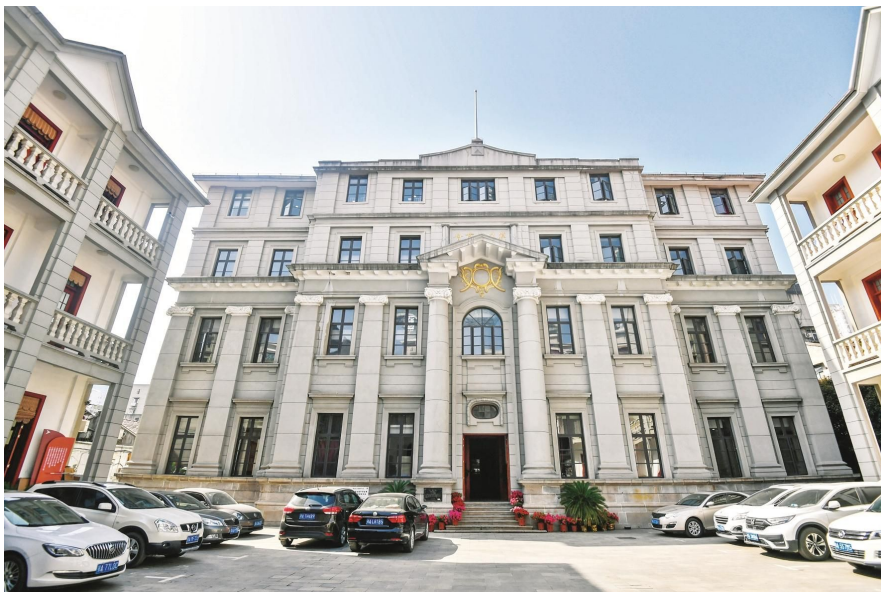
中华全国文艺界抗敌协会旧址