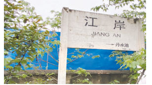
123岁江岸火车站完成使命