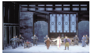
革命题材花鼓戏《红荷》火