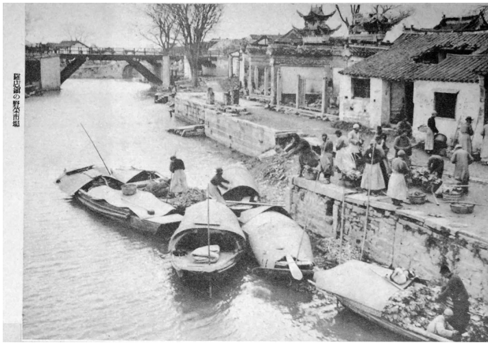
1938年春，上海郊区罗店的蔬菜市场，残垣断壁中的生活日常

抗战史研究不能离开对于“生活”和“日常”的观照，这些与将士在前线的浴血奋战一样，是筑成反侵略长城的基石。至于第四章关于侨商黄氏力图在战争年代守护家族商业利益的叙事，虽然与其他各章的话语有所不同，但依然清晰地揭示出日本侵华战争带来的灾难不仅是在狭义的军事领域，还体现在国人日常生活和民事领域的方方面面。