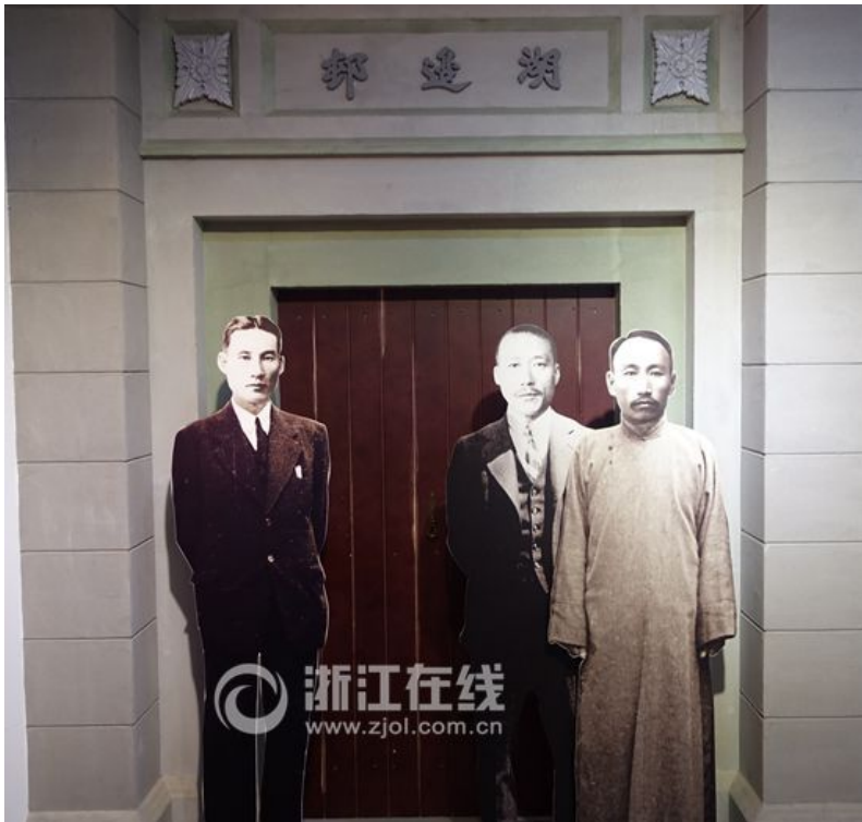
当时在杭州湖边村办公的三位国务委员

浙江在线杭州7月01日讯(浙江在线记者/李鹏首席编辑/赵洁)在杭州的众多名胜景点中，有一个地方不仅在韩国的知名度远超中国，甚至还是韩国历任驻上海总领事上任后的必访之地，它就是位于长生路55号的“大韩民国临时政府杭州旧址纪念馆”。