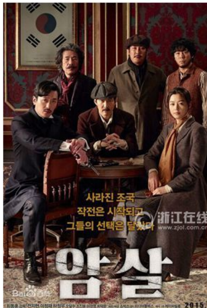
以中国船娘和韩国国父的故事为背景的《船月》（左）、以韩国义士在上海暗杀亲日派为背景的电影《暗杀》