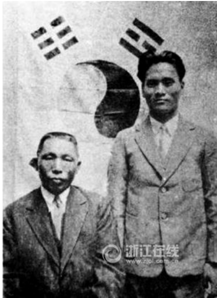
金九和尹奉吉合影

尹奉吉的义举正是金九直接策划的，这惊天的一声响，使得困难中的大韩民国临时政府和金九在中韩抗日义举中的威信大增，但也招致日军的疯狂报复和毁灭性的打击，日本军警特务到处在抓人，成立已经13年的临时政府再也无法在上海立足了，其中一批要员流亡到了浙江。