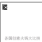
各国创意火锅大比拼