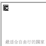
最适合自由的国家