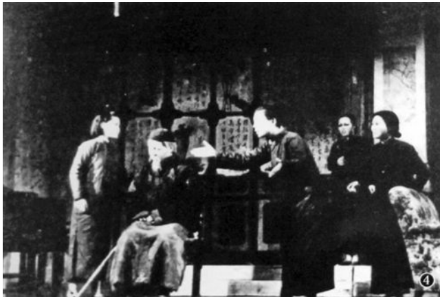
抗战期间，曹禺的话剧作品《北京人》在重庆上演。