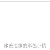
冰盖边缘的彩色小镇