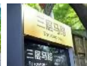
主城六大新鲜玩法...