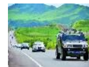
从重庆出发 这四条...