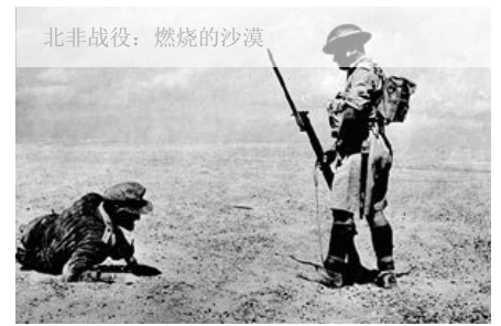
北非战役：燃烧的沙漠