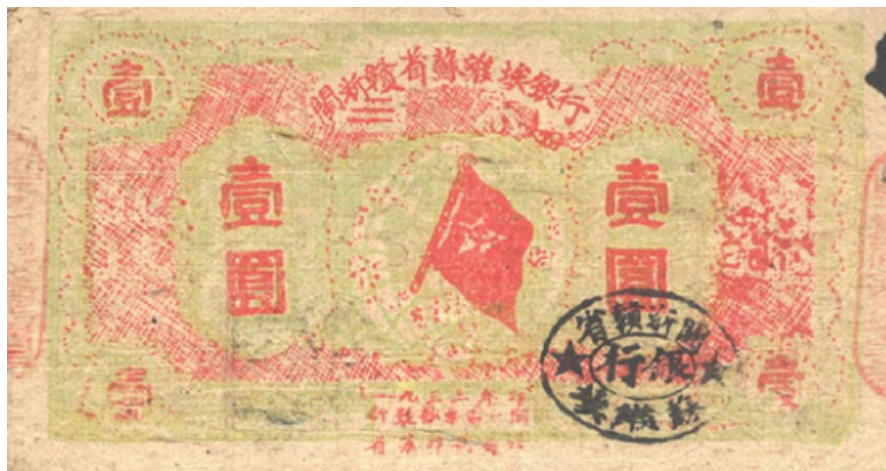
1933年闽浙赣省苏维埃银行壹圆

1933年9月，针对国民党对苏维埃的第五次“围剿”和经济封锁政策，闽浙赣省苏维埃政府决定发行10万股银行股票，