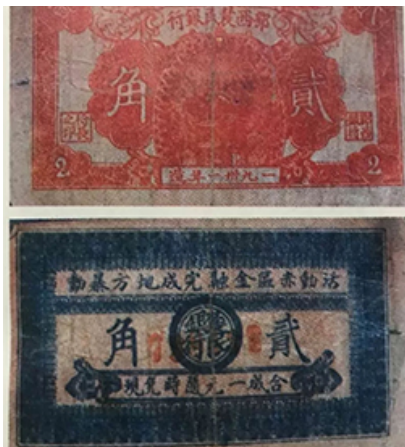
鄂西农民银行1931年版贰角券