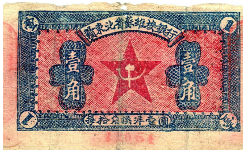
赣东北省苏维埃银行币