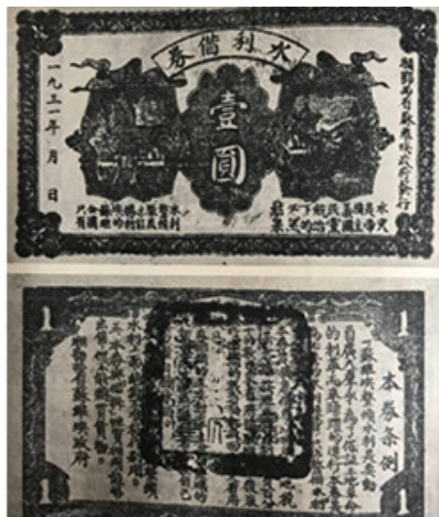
湘鄂西省苏维埃政府水利借券

1931年夏，洪湖苏区发生严重水灾。湘鄂西省苏维埃政府发行水利借券，筹措30万元资金，以为整修水利工程之用。借券条例全文为：（一）本券是为必要的水利经费，只占整个水利经费的百分之二十。（二）本券为无息借券，以明年的土地税作担保，各县按照本县水利经费的百分之二的数目来省府领取推销，后来按照所推销的数目全部收回，送交省府焚毁。（三）本券推销的对象，是赤白区域的商人和富农，其它热心水利者，可按自己经济力量自愿承销。（四）本券必须百分之百的用在整顿水利上面，绝对不准移作他用。（五）本券与“借据”性质相同，能够出售，但不能购买货物。