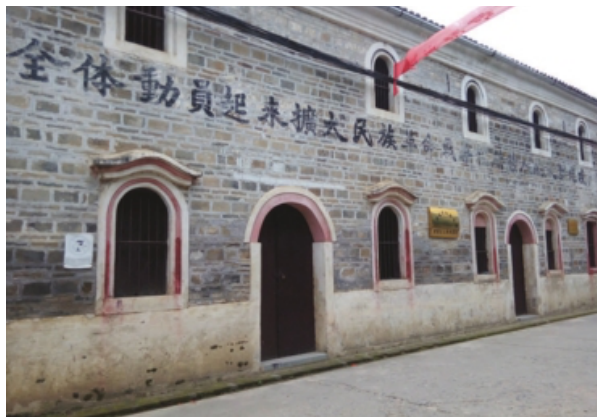
东固消费合作社旧址

中共东固区委决定在成立东古平民银行的同时创办东固消费合作社，以缓解日常用品供应紧张的困难，改善山区人民的生活，打破敌人的经济封锁。在东固区苏维埃政府拨款和群众集资的情况下，东固消费合作社正式挂牌成立。东固消费合作社与群众的生产生活关系最为密切，其主要任务有两项，一是收购当地的大米、茶油、笋干、烟叶、土纸等农副产品，然后设法将这些物资运到边界与白区商人及群众交换，换取食盐和布匹等根据地紧俏物资；二是以合理的价格向农民进行销售。目的是保障供给、搞活流通、减少剥削、增加群众收入。