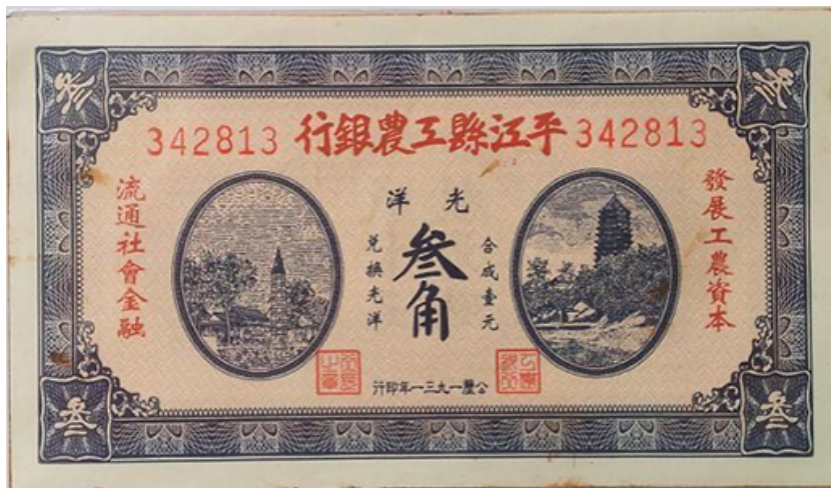
平江县工农银行纸币

使银行发行货币增多。到1932年4月，省工农银行已发行纸币30万元，但准备现金仅4万余元，以致发出的纸币无法兑现，曾发生拒用现象。为此，湘鄂赣省苏维埃政府于同月作出决定，省工农银行不再发行货币，已发行的限3个月内全部收回，所需银元10万元由各县苏维埃政府和红十六军分担筹措。货币收回后，湘鄂赣省工农银行撤销，另成立中华苏维埃共和国国家银行湘鄂赣分行。