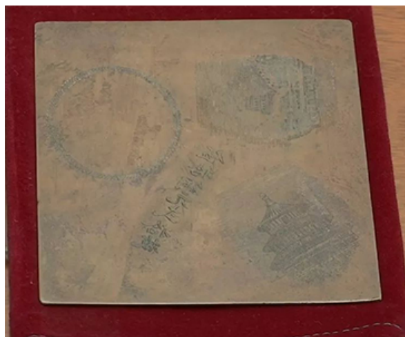
湘鄂西革命根据地印钞铜版

洋；白区商人来苏区，所带现洋，也必须到银行换成苏币，方可购货。当时，湘鄂西革命根据地还发展了担保、兑换和借贷等信用业务。