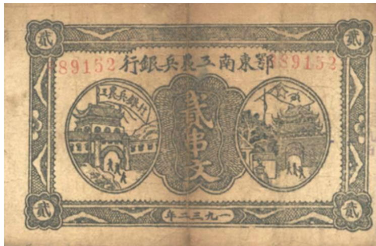
鄂东南工农兵银行貳串文