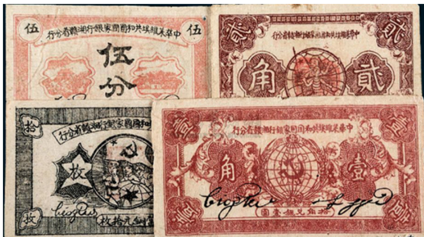
中华苏维埃共和国国家银行湘鄂赣边区八分纸币