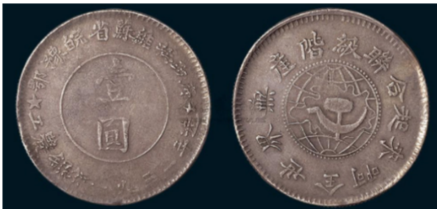
鄂豫皖省苏维埃政府壹圆

鄂豫皖革命根据地是在1927—1929年期间鄂东北的黄麻起义、豫东南的商南起义、皖西的六霍起义等基础上，创立的在鄂豫皖三省边界以大别山为中心的革命根据地。1930年10月，鄂豫皖特区苏维埃银行在七里坪成立，其职能主要是通过借贷、储蓄、兑换等业务工作，筹集资金，帮助根据地的人民发展工、农、商业。对于农民用于购置耕牛、农具、种子的贷款，一律免息，其余贷款酌量收息。银行还发行过多种面值的纸币、布币、铜币、银元和“经济公社流通券”（购油、布等物的凭证）。