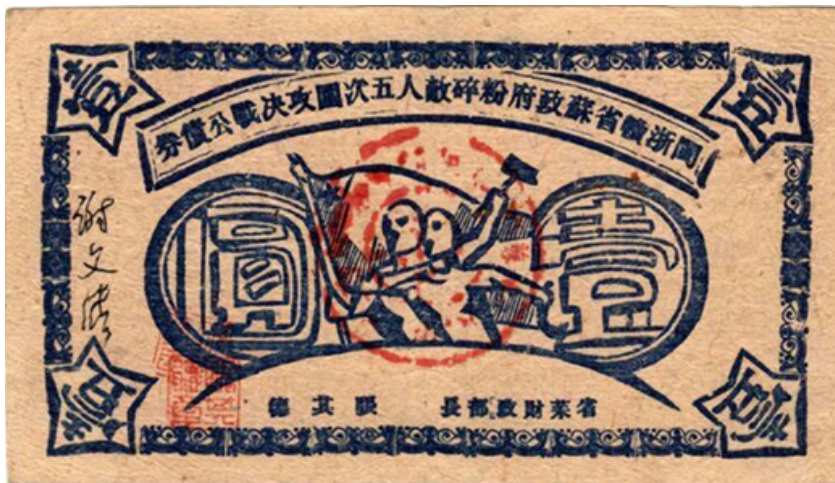
閩浙贛省蘇政府粉碎敵人五次圍攻決戰公債券