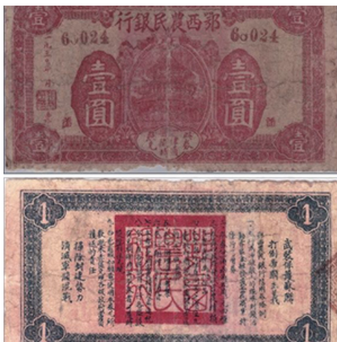
鄂西农民银行1930年壹圆篆体“武”字版

“鄂西纸币”的印发和流通时期正处于革命斗争的白热化阶段。票面的设计理念和构图元素，也“如实地反映了当时社会相相应的斗争形势和革命要求”。比如，将“活动于全国农村根据地之货币”“革命口号向有青色和青色位用半的版面