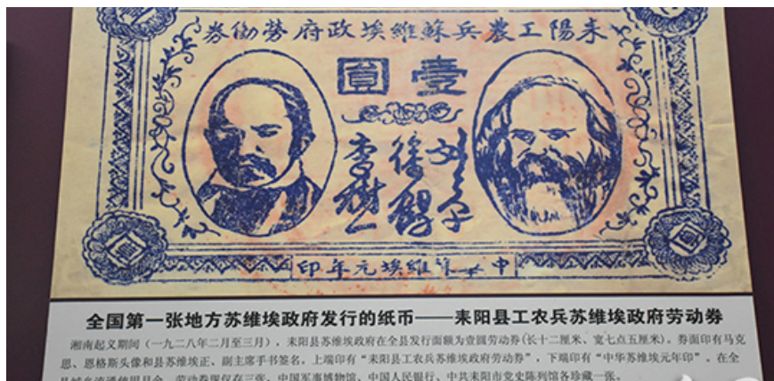
湖南耒阳市党史展览馆展示墙上的劳动券展示画