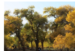
额济纳自然遗迹受游客欢迎