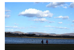
乌兰布统草原秋色如画

注意！国庆期间禁止危化品运输车在高速通行 内蒙古“不用跑腿 企业登记注册”“一窗办理” 包头各高速出口ETC投入使用 无需排队交费 十一期间呼和浩特市四大主题旅游线路推荐 10月1日起内蒙古居民可区内地异地办理身份证