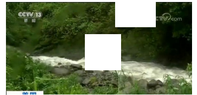
美国热带风暴“奥利维亚”袭击夏威夷