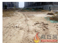
已完成雨、污水管网...