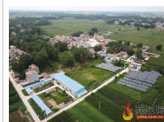
惠济乡荣堂村：村美...