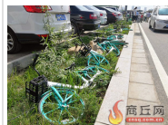
绿化带内 单车“睡觉”