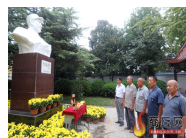
八里庄：昔日将军殉...