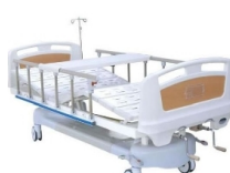
生产陪护床的厂家