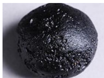
玻璃陨石多少钱一克