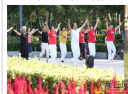
全民健身月 你我共参与