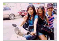
泰国“剩女”为何那么多