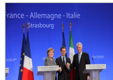
“保卫欧元！”法德意三国领导人携手表决心