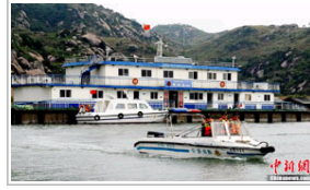
高清：探访全国首个海上“110”