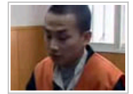
男子找工作不顺 为消 气连砸5座地铁站