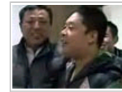
的哥及时出手救孕妇 雪中温暖人心