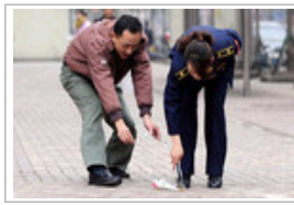
重庆城管佩带蛋糕夹上街拾垃圾