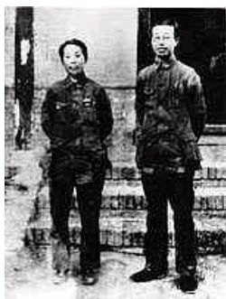
图: 1938年杨秀峰和孙文淑在太行山