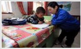
人物特写：120厘米高“袖珍妈妈”撑起四口之家