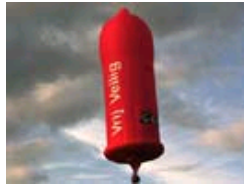
荷兰巨型“安全套”升空