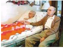
打破“最长婚姻”纪录