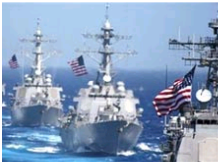
美军关岛大演兵 规模堪称历史之最