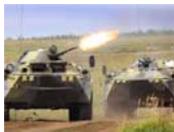
和平使命07反恐军演