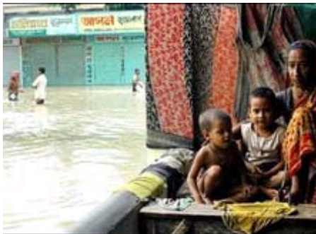
南亚水灾造成近1900人死亡